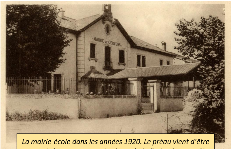
La mairie-école dans les années 1920. Le préau vient d'être construit (comparer avec la photo du bulletin n°1-page 8).

En 1900, le bâtiment de la mairie-école s'agrandit d'une salle pour accueillir l'école enfantine (école maternelle, actuellement bureau d'accueil de la mairie).