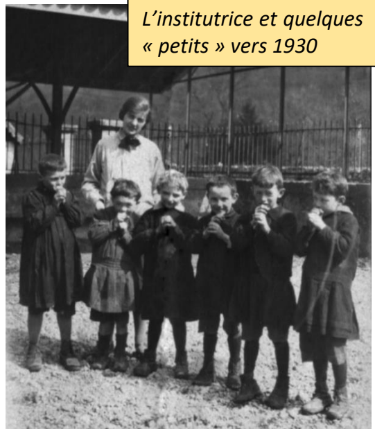
L'institutrice et quelques « petits » vers 1930