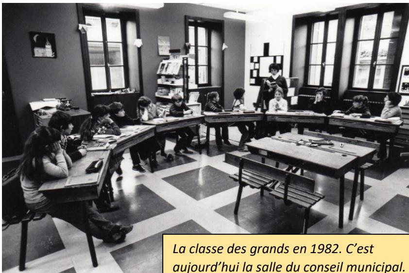
La classe des grands en 1982. C'est aujourd'hui la salle du conseil municipal.

L'école à deux classes fonctionne sans grand changement jusque vers 1995, date à laquelle une troisième classe ouvre dans l'ancienne salle des fêtes, rénovée et adaptée pour ses nouvelles fonctions.